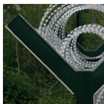
sur bavolets simple ou double