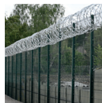
au pied ou en haut de clôture